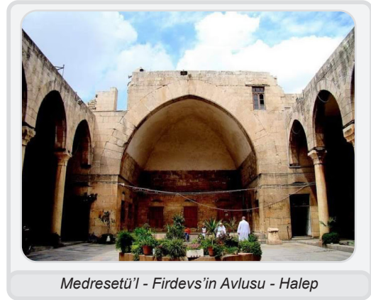
Medresetü'l - Firdevs'in Avlusu - Halep