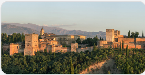
El Hamra Sarayı – İspanya