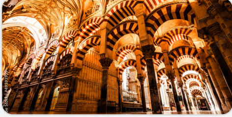
Kurtuba Camii – İspanya