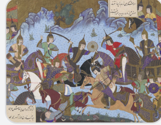
Ak Hunlara karşı savaşan Sasani generali Sukhra'yı gösteren Şehnâme çizimi (484)

Yukarıdaki görselden yola çıkarak Sasanilerin kullandığı savaş teçhizatlarını yazınız.