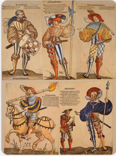
Orta Çağ'da Avrupalı Paralı Askerler

Paralı askerlerin kolektif bir biçimde bir araya gelmesi ise orduların para karşılığı kiralanmasını, ücretli ordu sistemini ortaya çıkarmıştır. Para karşılığı kiralanmış orduların atası olan "condottiere" ise Orta Çağ'ın sonlarında İtalya'da görülmüştür. İtalyanca sözleşme (condotta) kelimesinden türemiş olan "condottiere" sisteminde özel ordular sözleşme yaparak İtalyan prensliklerini korumuşlardır.