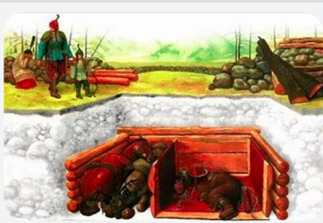
Eski Türklerde Mezar