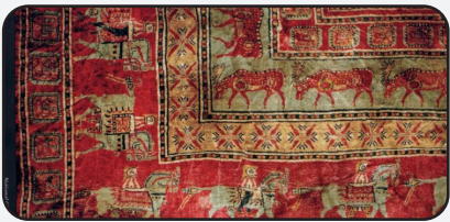
10cm 2 'de 36 bin Gördes Düğümü atılan Pazırık Halısı