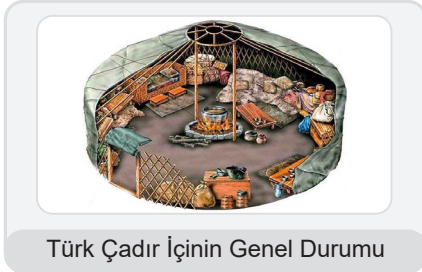
Türk Çadır İçinin Genel Durumu