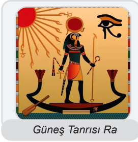
Güneş Tanrısı Ra