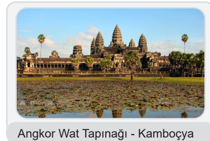
Angkor Wat Tapınağı - Kamboçya