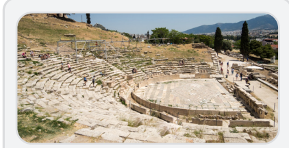
Dionysos Tiyatrosu - Atina