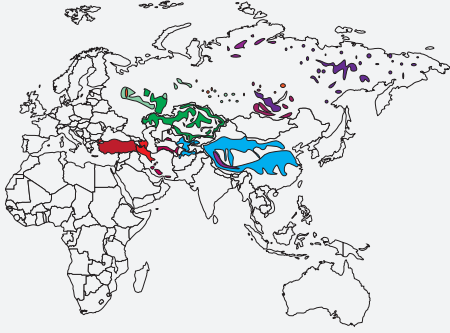
Türklerin Günümüzde Yaygın Olarak Yaşadığı Bölgeler