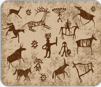
Av hayvanları ve insanları gösteren çizimler