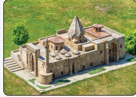
Divriği Ulu Cami

Yukarıdaki görsellerden yola çıkarak Türk toplumunun kimliği hakkında neler söylenebilir?